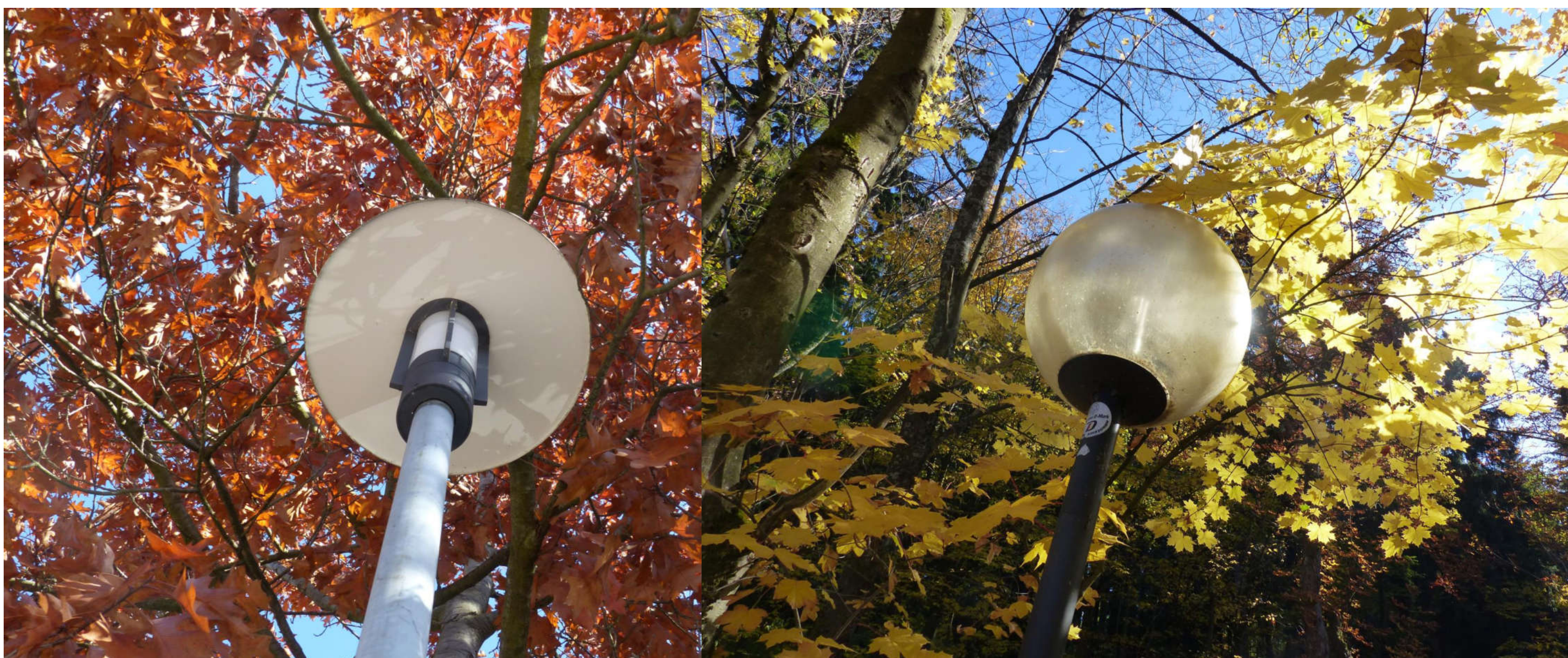
Im Rahmen der Kartierung fotografisch erfasste Lampenköpfe.